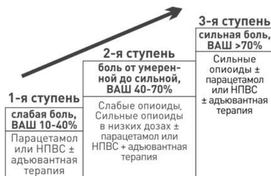
Визуально-аналоговая шкала (ВАШ) интенсивности боли

На третьем этапе – сильной и нетерпимой боли. Переходят к использованию более высоких дозировок сильных опиоидов (Морфин в таблетках, капсулах пролонгированного (12 часов) или короткого (4-6 часов) действия; ТДС (трансдермальная терапевтическая система, то есть пластырь) с Фентанилом; Таргин (таблетки, содержащие Оксикодон)